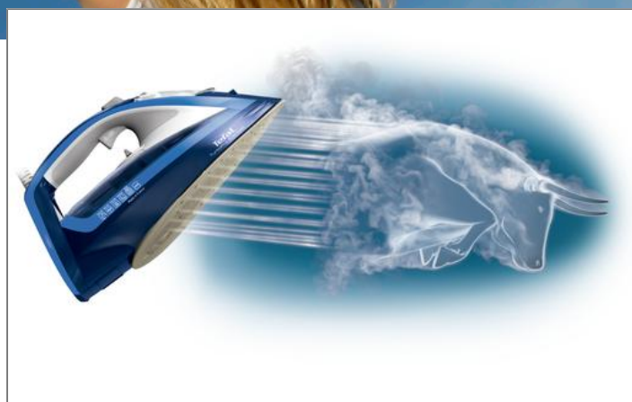
TURBO PRO ANTI-CALC FV5630E0 Napařovací žehlička Tefal TurboPro Anti-Calc FV5630 FV5630E0